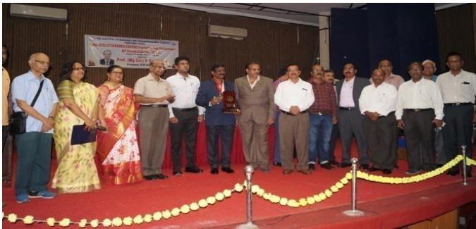
Executive Committee with Best Centre Award