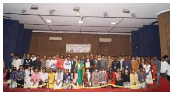
1st Best ISF Centre Award-VJIT