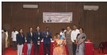
3rd Best ISF Centre Award-St.Petres