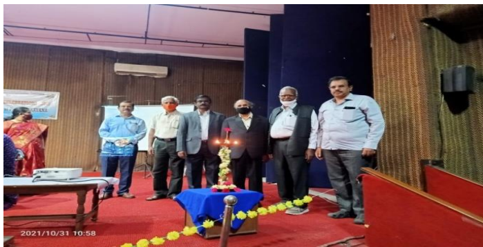
Lighting of Lamp