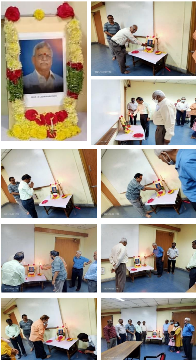
Photos of Condolence Meeting