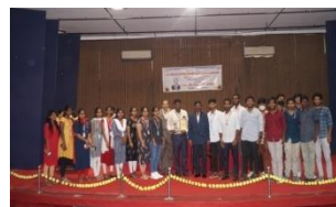
2nd Best ISF Centre Award-BIET