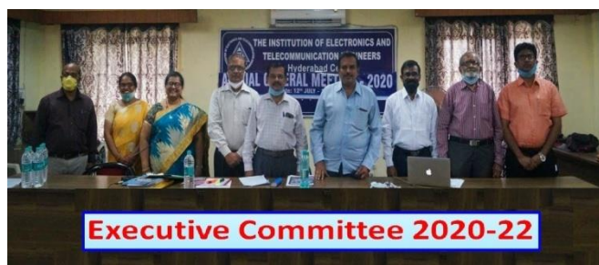
Executive Committee 2020-22